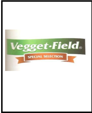
Logo de la Empresa