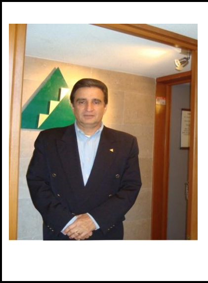
Foto del Director Genral