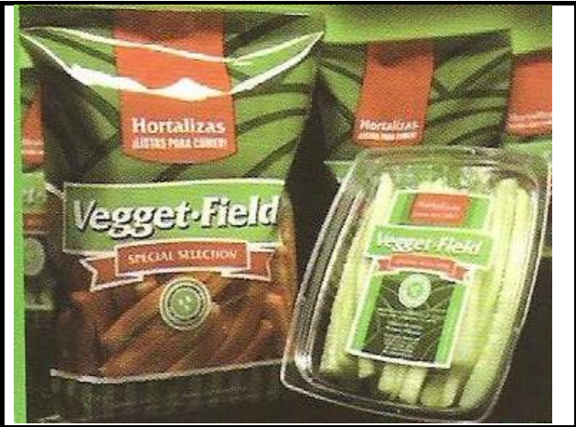
Imagen del Producto - Servicio o Sugerencia de Uso